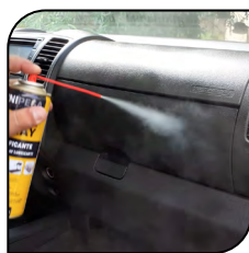
Painel de Veículo