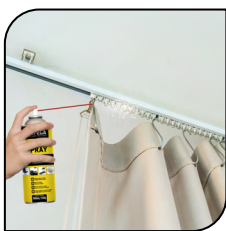
Trilho de Cortina