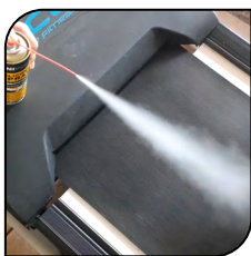
Esteira de Ginástica