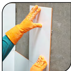
Cerâmica e Azulejo