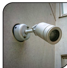
Concreto e Alvenaria