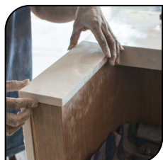
Pedra e Mármore